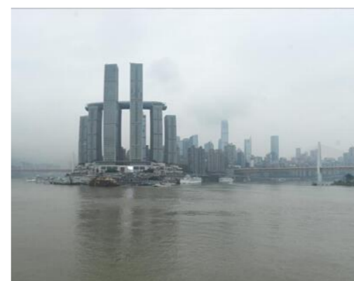
三峡水库水位逼近175米 库区再...