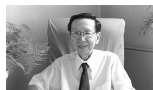
物理化学家刘若庄院士逝世