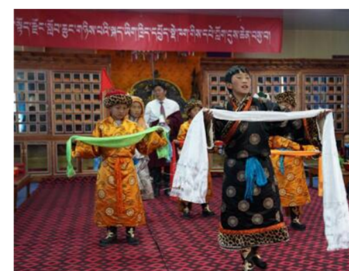
青海杂多小学生传承格萨尔说唱