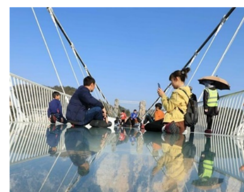
湖南张家界：初冬乐享户外运动