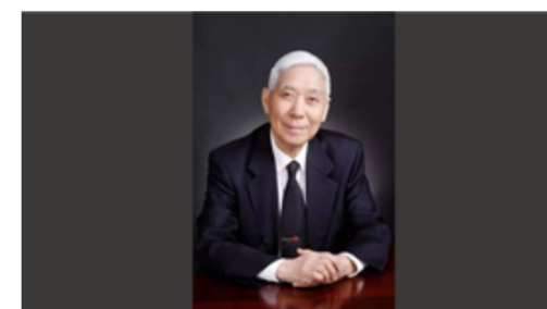
中国工程院院士陈灏珠逝世